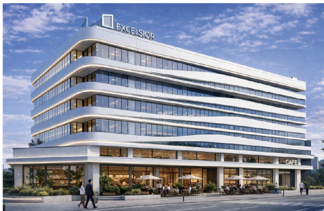
● 日友「商辦大樓」外觀示意圖

台灣昌鴻旗下跨國企業「日友不動產」應眾多台商期盼，終於在熊本「水前寺」近處推出首案商辦大樓且已連袂太平洋公司啟動預購，消息不脛而走，預訂者眾，儼然如台商在熊本的台式節祭一般，不僅熱絡相挺，更帶著一股如慶典般的歡欣氣息。開心！